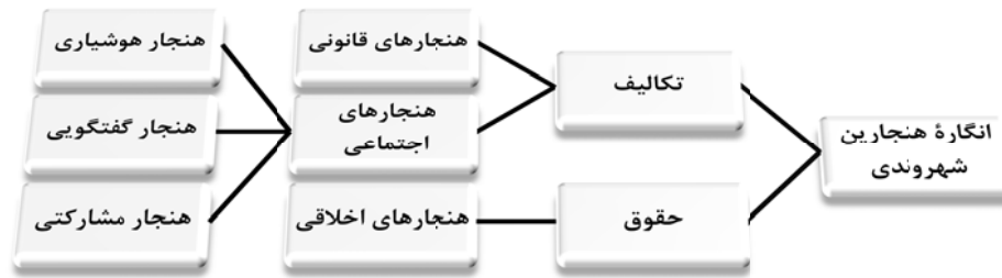
شکل (۲). مؤلفه‌های انگاره‌های هنجارین شهروندی

لازم به یادآوری است که در این کار به این دلیل بعد نگرشی برای سنجش انتخاب شده است که نگرش به گامی پس از آگاهی و پیش از عمل اشاره دارد و از این رو هم آگاهی و هم جهت گیری مثبت و هم میل به عمل را در خود دارد. از این منظر اگر شهروندی را همچون آرنت و ترنر به مثابه یک عمل اجتماعی و گسترانندهٔ منزلت معطوف به آن ببینیم، نگرش مثبت به هنجارهای شهروندی مقدمهٔ لازم بر وقوع آن عمل محسوب می‌شود.