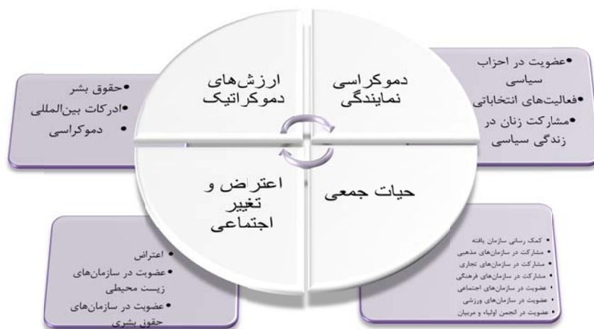
شکل (۱). شهروندی فعال از نظر هاسکینز

که تعریف عملیاتی روشنی از شهروندی فعال و آنچه یک شهروند خوب باید انجام دهد وجود نداشته است، عمده تلاش آن‌ها در این پروژه معطوف به ساخت سنجه ای ترکیبی برای سنجش شهروندی فعال بوده است. چارچوب بسط داده شده در این مقاله برای سنجش پدیده شهروندی فعال شامل چهار بخش است: