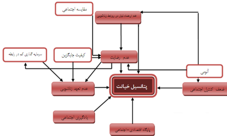
مدل تحلیلی تحقیق