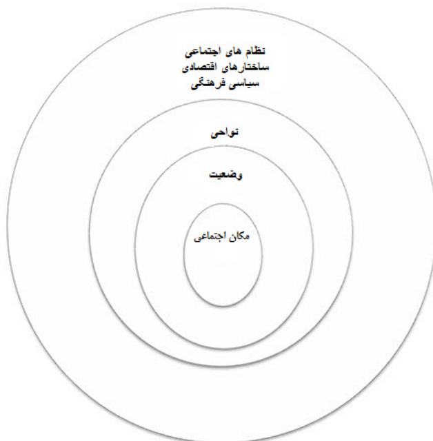
شکل ۱: رابطه بین مکان اجتماعی مورد مطالعه، وضعیت، نواحی و نظام اجتماعی

نظام اجتماعی ۱ : نظام‌های اجتماعی تأثیر و نفوذ درونی و بیرونی بر کنش‌های اجتماعی داشته و در سراسر جامعه پراکنده‌اند. از طریق این نظام‌ها، فعالیت‌های الگومند در مسیرهای زمانی و مکانی بازتولید می‌شوند. نظام‌های اجتماعی، اقتصادی، سیاسی و فرهنگی از جمله شرایطی است که به الگوهای اجتماعی موجود در درون مکان اجتماعی مورد مطالعه شکل می‌دهند. انسجام اجتماعی و انسجام سیستمی دو مورد از ویژگی‌های اساسی نظام اجتماعی است. کارسپیکن چارچوبی را جهت فهم و شناخت نظام‌های اجتماعی فراهم آورد. او مدلی را برای بازتولید فرهنگی مطرح نمود که در آن جامعه به جای آن که کلیتی منفرد و مجزا در نظر گرفته شود، مجموعه پیچیده‌ای از عواملی است که با یکدیگر تعامل دارند (کارسپیکن، ۱۹۹۶: ۳۶-۳۴).